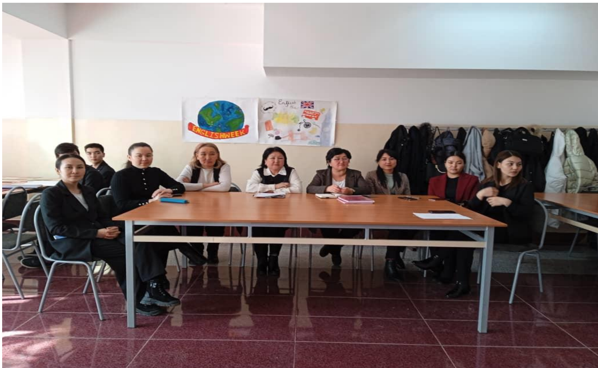
Англис тил усулдук бирикмесинин декадасынын жабылышына администрациянын, мугалимдердин катышуу учуру.