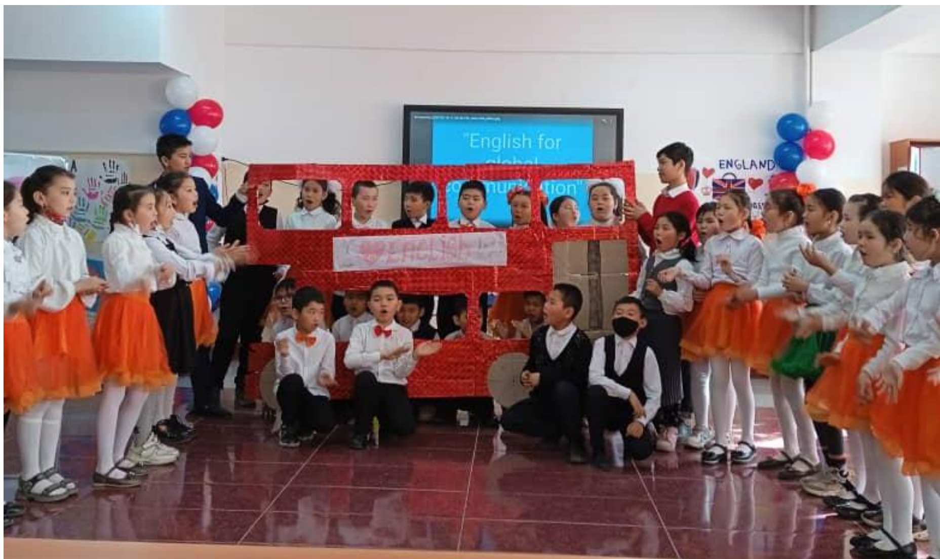
Англис тил усулдук бирикмесинин декадасынын жабылышын окуучуларбарууда 3-класстын окуучулары англисче “Паровоз” ырын аткарууда.Окуучулардын бийлеп берүү учуру