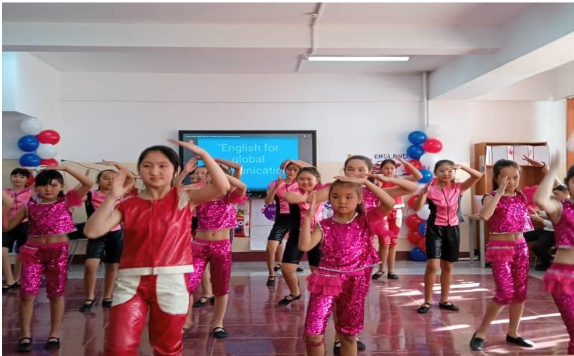
Окуучулардын бийлеген учуру