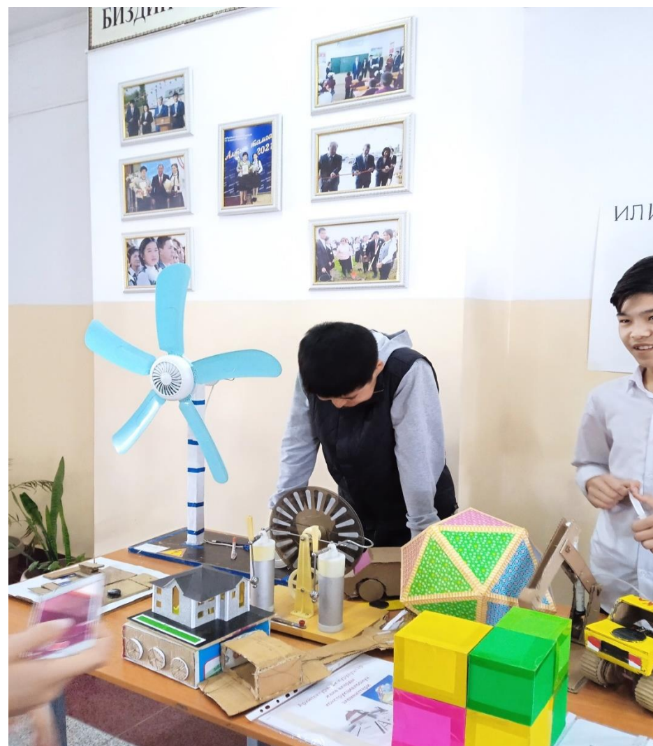
Физика сабагынан таланттуу, чыгармачыл балдардын ойлоп табуу буюмдары.