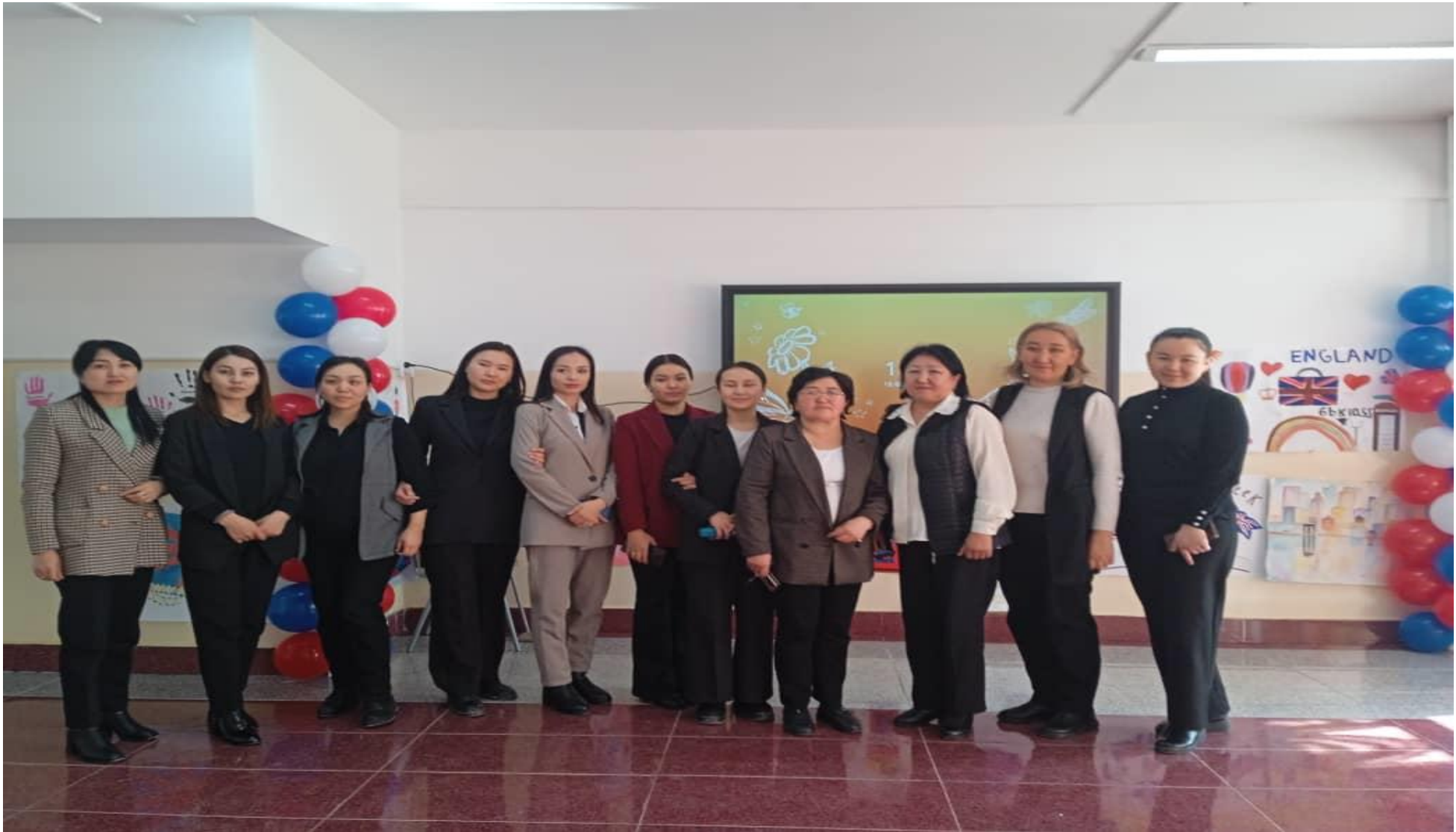
Англис тил усулдук бирикмесиндеги мугалимдери