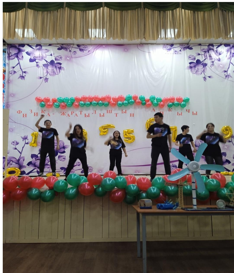
Окуучулардын бий аткаруу учуру.