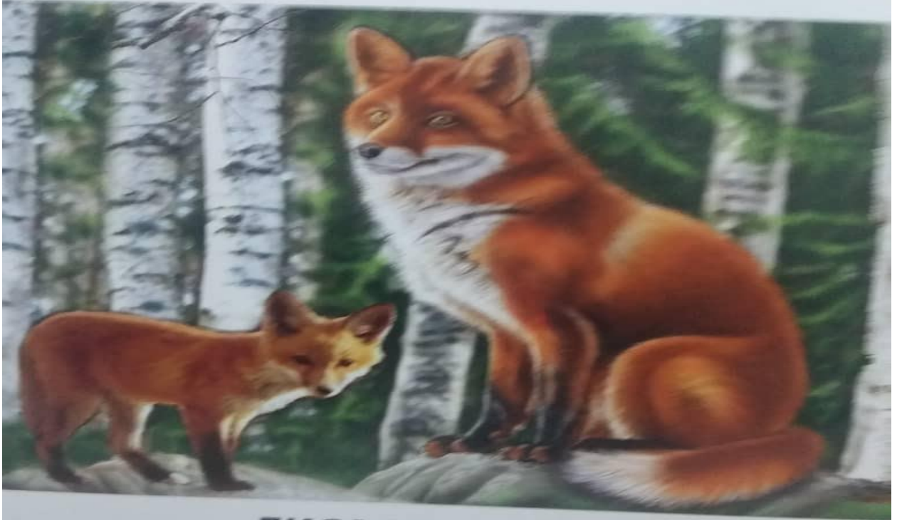
ЛИСА И ЛИСЕНОК